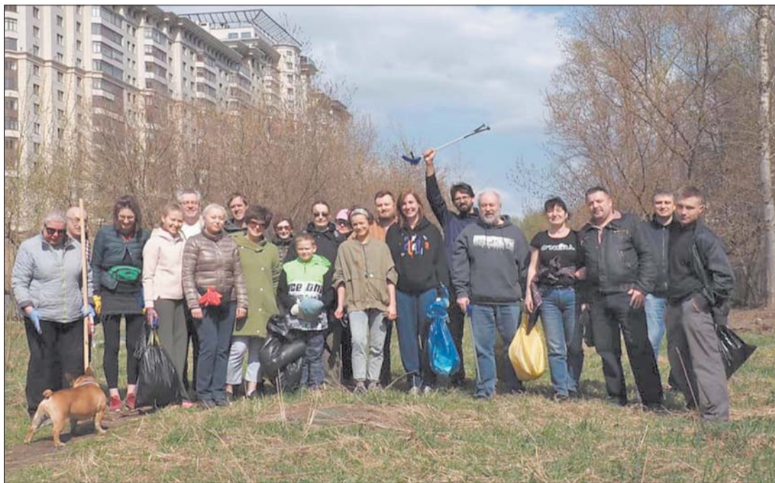
«Соседский субботник» 18 апреля