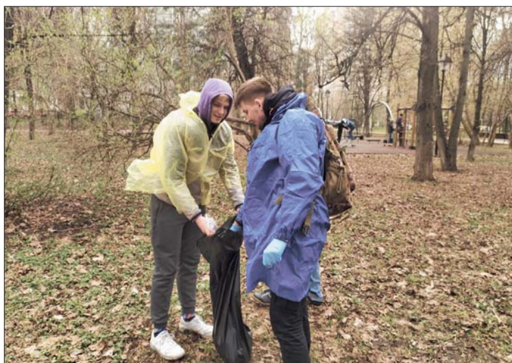
Субботник 25 апреля

18 апреля «Соседский субботник» прошел на природной территории, расположенной между улицей Дмитрия Ульянова, 8, корпус 2 и улицей Ивана Бабушкина, 12, корпус 3 («Заповедный луг»).