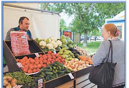
4 Ярмарка выходного дня