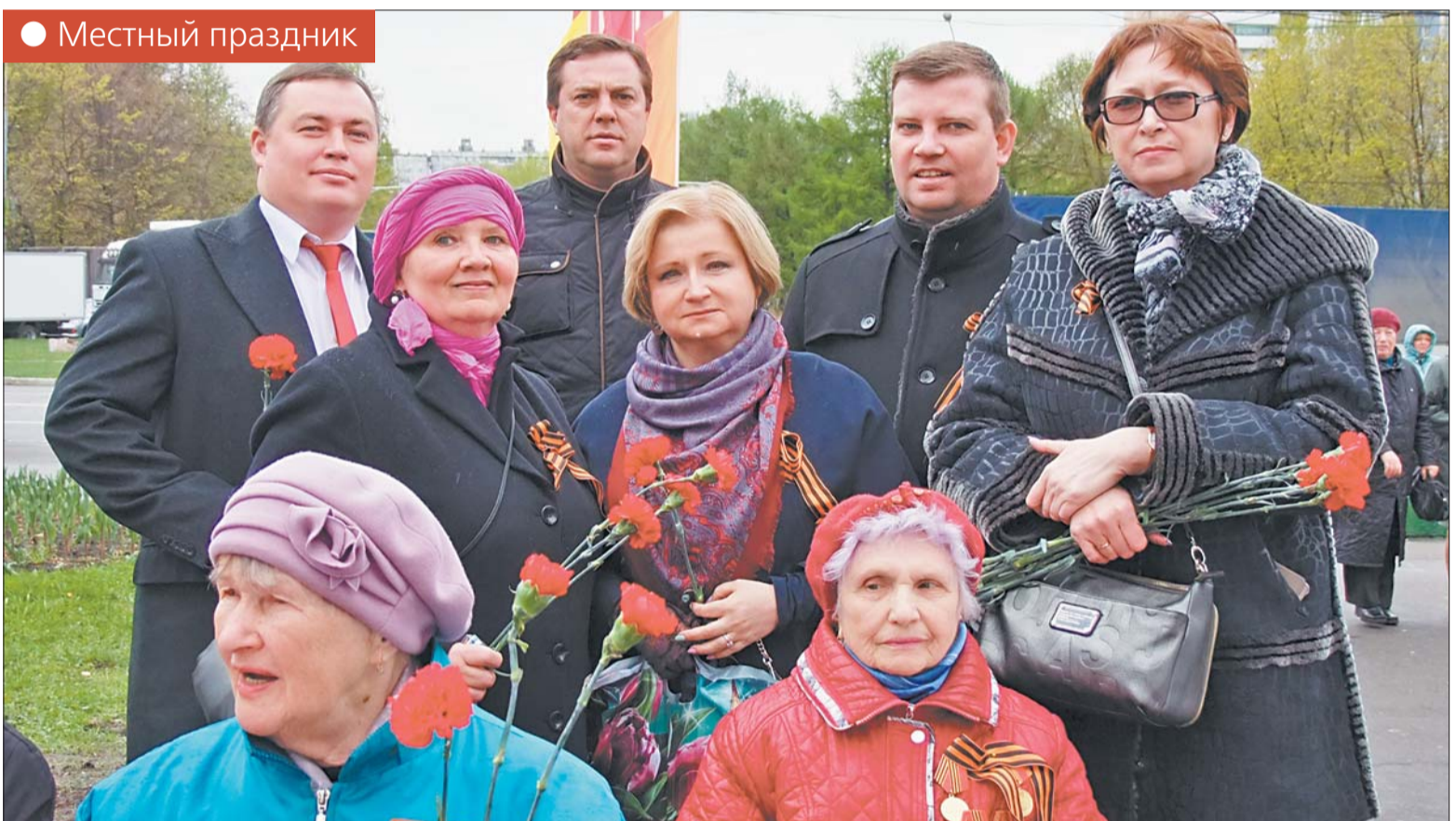
● Местный праздник