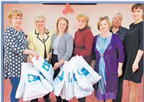
2 Пусть лето будет теплым!