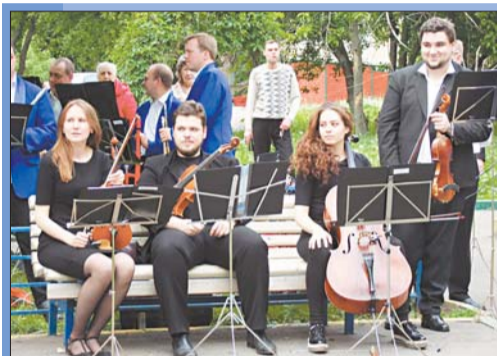
3 В городском саду играет...